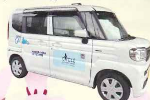
「スパーシア号」は公益財団法人JKAからの補助車両です。