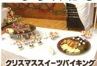
クリスマススイーツバイキング

今年のクリスマスもスイーツバイキングを開催しました。今回はクリスマス気分を感じていただくことをテーマに飾り付けやメニューを考えました。