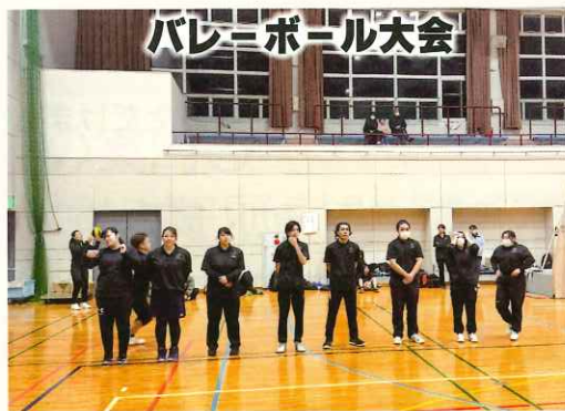
バレーボール大会