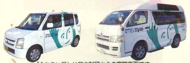
「ふれあい号」は日本財団からの寄贈車両です。

このたび、当法人は、独立行政法人高齢・障害・求職者雇用支援機構より、高齢者雇用の推進に積極的に取り組む事業所として「理事長優秀賞」を受賞いたしました。本賞は、高齢者が長年培ってきた知識や経験を活かし、安心して働き続けられる職場づくりに取り組む企業や団体の中でも、特に優れた活動を行っている事業所を表彰するものです。