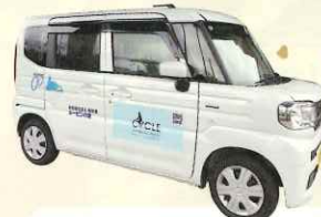
「スペーシア号」は公益財団法人JKAからの補助車両です。