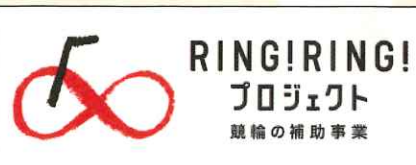
ルーピンの里は日本自転車振興会の補助物件です