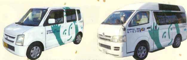
「ふれあい号」は日本財団からの寄贈車両です。

福寿会では職員の交流を兼ねた親睦会として夏に「暑気払い」冬に「忘年会」を定期的で開催しています。11月5日鹿屋市の「ティヌカーラ」にて職員家族を含め101名と多くの参加者で開催いたしました。日頃はなかなか言葉を交わす機会の少ない職員同士も忘年会を通して交流が深められました。