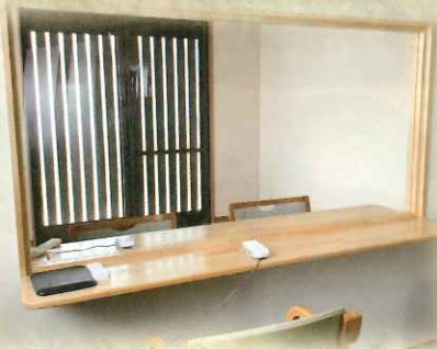
グループホーム面会室室内