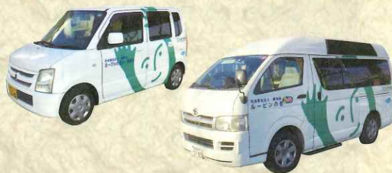
「ふれあい号」は日本財団からの寄贈車両です。