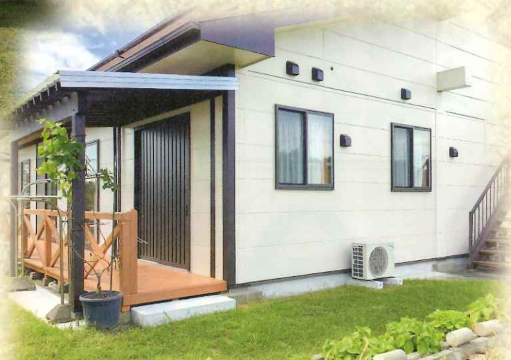
グループホーム家族面会室