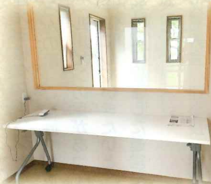
特養面会室の室内